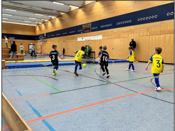
Bambini-Spieltag in Weil der Stadt

Auch diese Saison waren die kleinsten Fußballer im Alter zwischen vier und sieben Jahren aktiv dabei. Einmal wöchentlich treffen sich die Kinder auf der Wanne oder im Winter in der Stadthalle zum Training. Altersgerecht werden die Kinder in die Grundzüge des Fußballs eingeführt und verbessern nebenbei die Motorik, Koordination und Fitness. Zudem wird ein besonderes Augenmerk auf das Vermitteln der sportlichen Werte wie Fairness und Teamgeist gelegt.