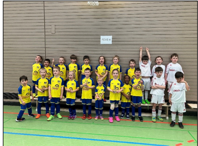
Bambini-Spieltag in Höfingen

Bis zu den Sommerferien sind noch drei Turniere in Heimerdingen, Iptingen und Renningen geplant. Dazu kommen noch zahlreiche Spieltage in der Umgebung sowie als besonderes Highlight unser eigener Spieltag im Juni in Heimsheim auf der Wanne.